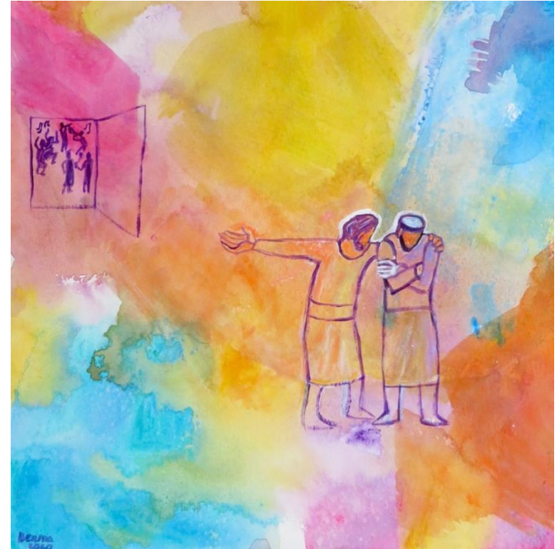
Lc 15, 28,b

La joie de Noël est en nous, sans attendre que cessent les violences.